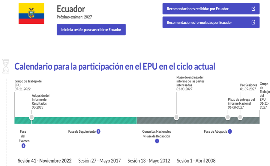
Gráfico No. 2 Pasos a seguir: EPU Ecuador