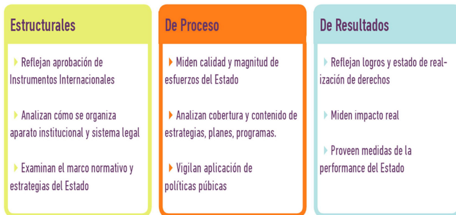
Gráfico No. 4

Fuente: Herramientas para la Participación de la Sociedad Civil en el seguimiento e implementación de la Convención de Belém do Pará. 26