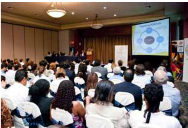
Evento: Foro Sobre Responsabilidad Social y Responsabilidad Social Empresarial, Guayaquil, 9 de Abril 2010