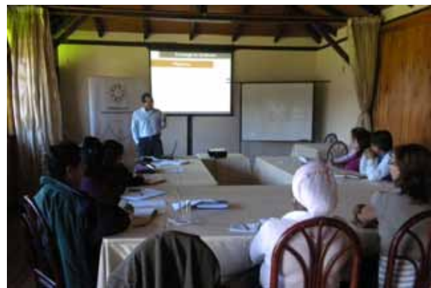
Evento: Taller: Definición de Temas Estratégicos de Trabajo de la Plataforma de Responsabilidad Social, Quito 15 de mayo de 2010 Foto: Representantes de las Organizaciones a la Plataforma de Responsabilidad Social.