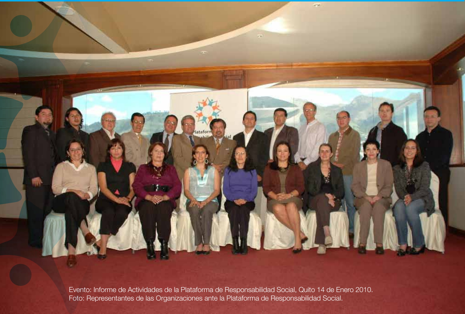
Evento: Informe de Actividades de la Plataforma de Responsabilidad Social, Quito 14 de Enero 2010. Foto: Representantes de las Organizaciones ante la Plataforma de Responsabilidad Social.