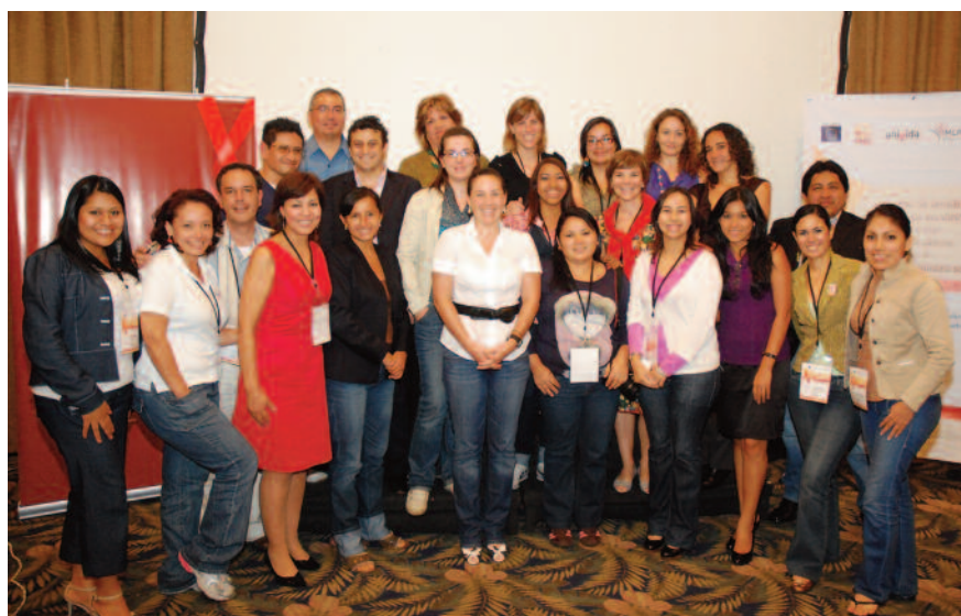
Periodistas de América Latina participantes de la IMLAS

La iniciativa tuvo importante acogida y contó con 11 periodistas internacionales de México, El Salvador, Nicaragua, Panamá, Colombia, Perú, Chile, Argentina y Brazil y 10 periodistas representantes de medios nacionales tales como Ecuador TV, Ecuavisa, Diario El Universo, Diario El Telégrafo, Diario La Hora, Radio Antena 3, Radio de la Universidad Santiago de Guayaquil, Revista Vistazo entre otros.