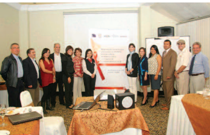
Directores de Medios de Comunicación

Con esta experiencia, gracias al financiamiento de CARE UK, UNIÓN EUROPEA, el proyecto UNIVIDA y la Iniciativa de Medios Latinoamericanos sobre el SIDA (IMLAS), con el financiamiento de UNICEF y el apoyo de ONUSIDA, organizaron un evento en Guayaquil el 26 y 27 de octubre del 2009.