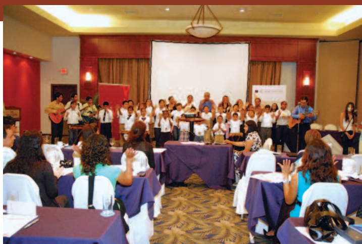
Niños y niñas de la Banda Infantil Costeña

Los periodistas interactuaron con la banda infantil costeña con mucha alegría y posteriormente abrazaron con afecto y solidaridad a estos seres triunfadores ante la vida.