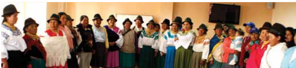
Reuniones de monitoreo y aprendizaje regional